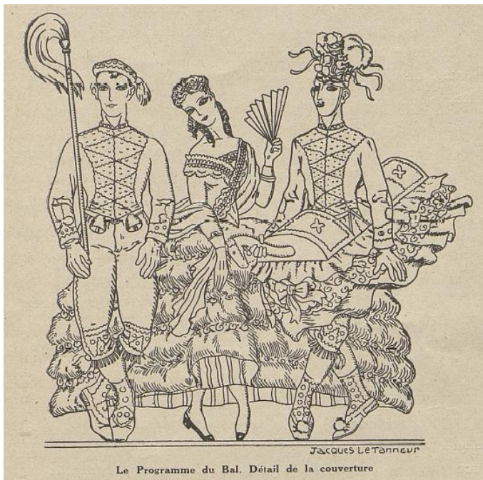
Le Programme du Bal. Détail de la couverture