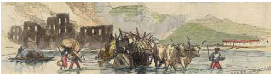
The Illustrated London News, 31 octobre 1874, Scène d'exil après la bataille de Béhobie. Zumalakarregi Museoa

L'exposition dévoile un aspect méconnu du conflit carliste : la manière dont il fut perçu et vécu au nord de la frontière.