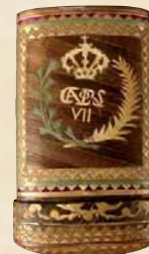
Étui à cigares au chiffre de Carlos VII. Offert par Don Carlos à Paul Laborde. Paille tressée. Coll. part.