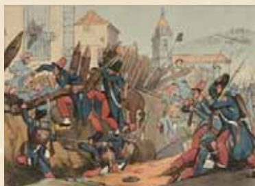
Major C.V.Z. La Légion étrangère française attaque une position carliste. Gravure, 1837. Zumalakarregi Museoa

Evocation des antécédents militaires et idéologiques des guerres carlistes : l'opposition entre libéraux et défenseurs de l'Ancien Régime apparaît avec l'arrivée des idées de la Révolution française en 1793. De 1808 à 1814, la lutte contre Napoléon constitue une première expérience de guérilla.