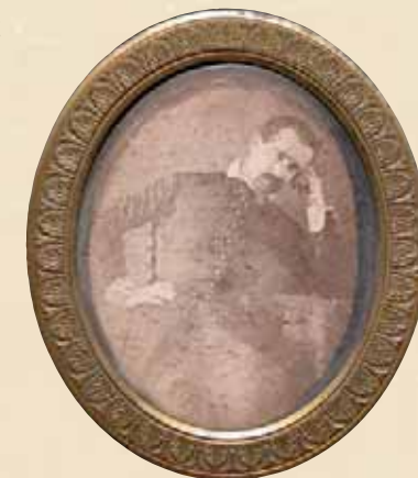
Augustin Chaho. Tirage photographique, vers 1850. Musée Basque et de l'histoire de Bayonne